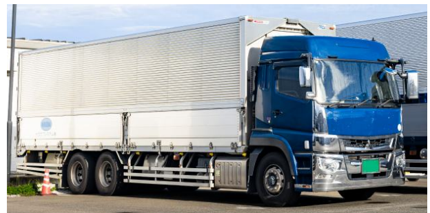
②大型貨物車(ウィング車)での運送