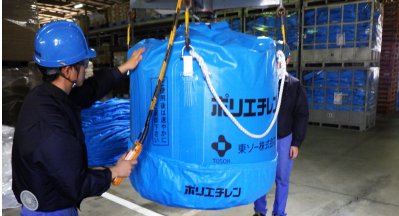
①フレコン充填作業