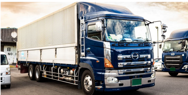
①大型ダンプ車での運送