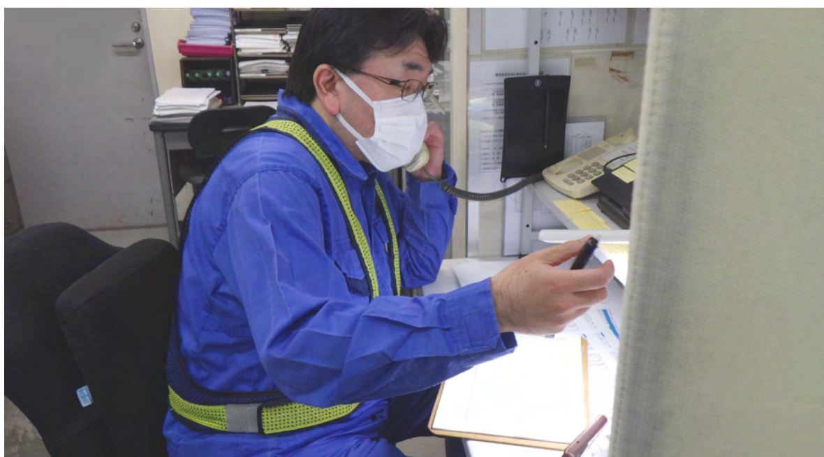
構内出荷事務所 出荷事務業務①