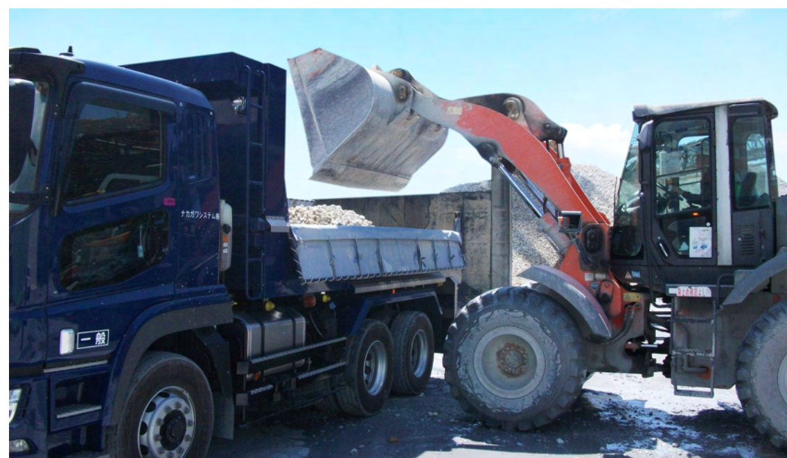
タイヤショベル 原料積込作業②