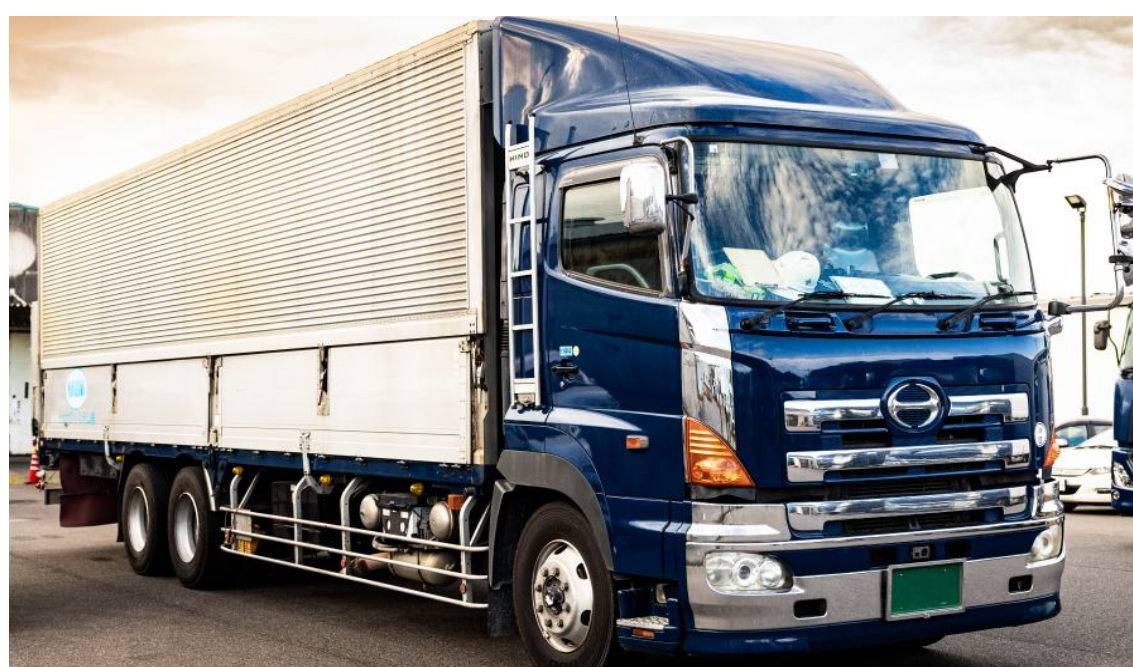
大型ダンプ車での運送