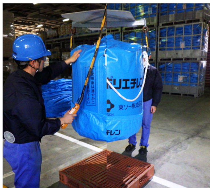
フレコン充填作業