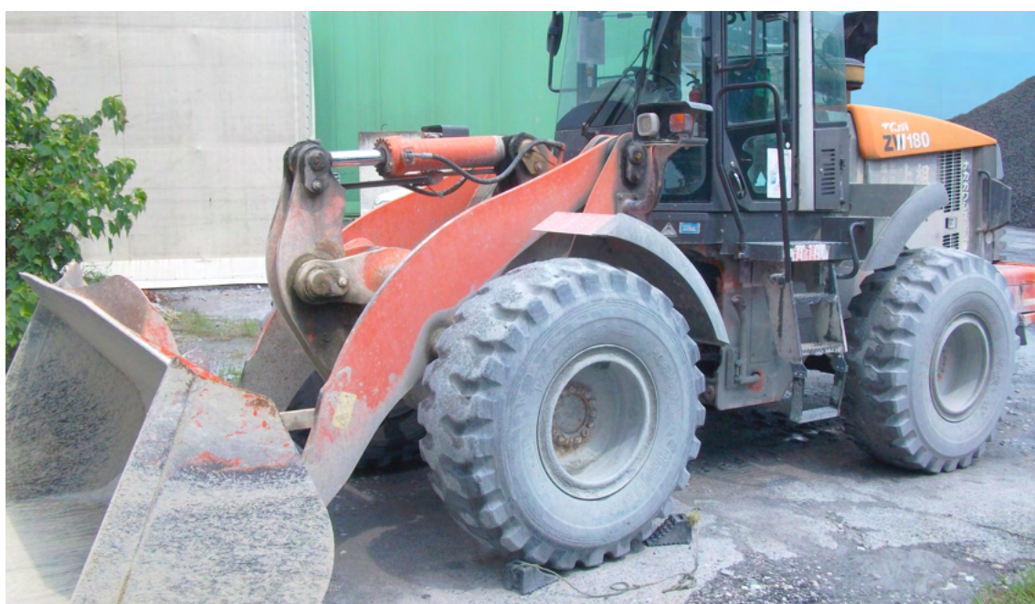
タイヤショベル 原料積込作業①