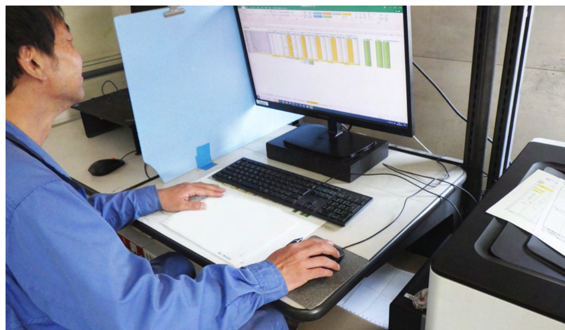
構内出荷事務所 出荷事務業務②