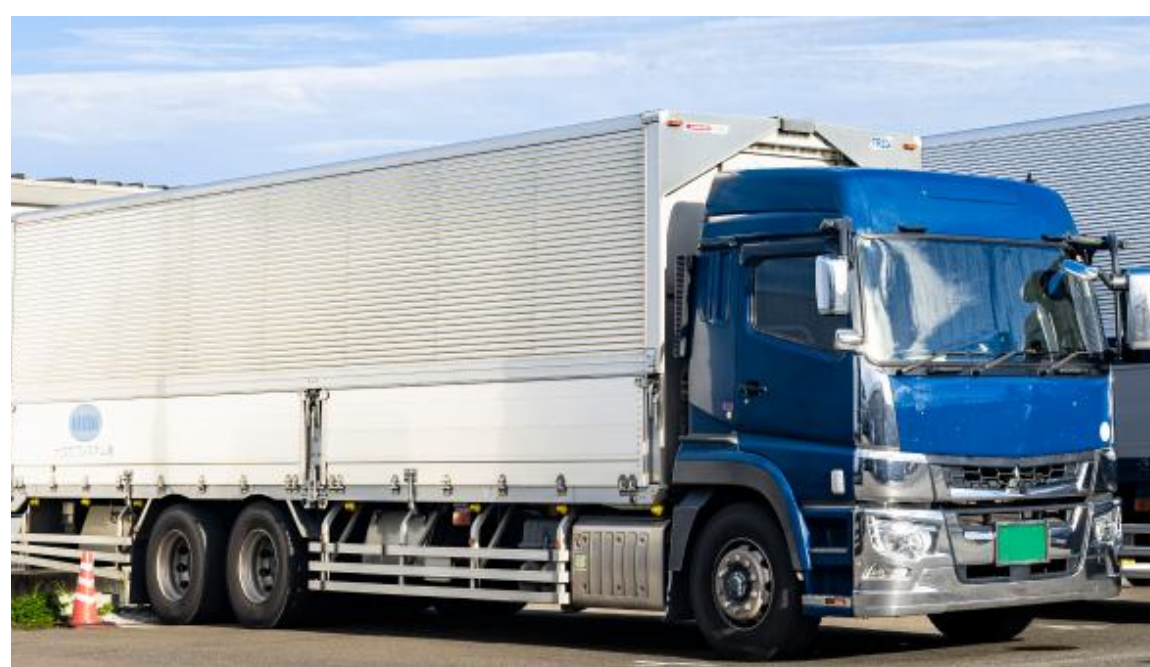
大型貨物車（ウィング車）での運送